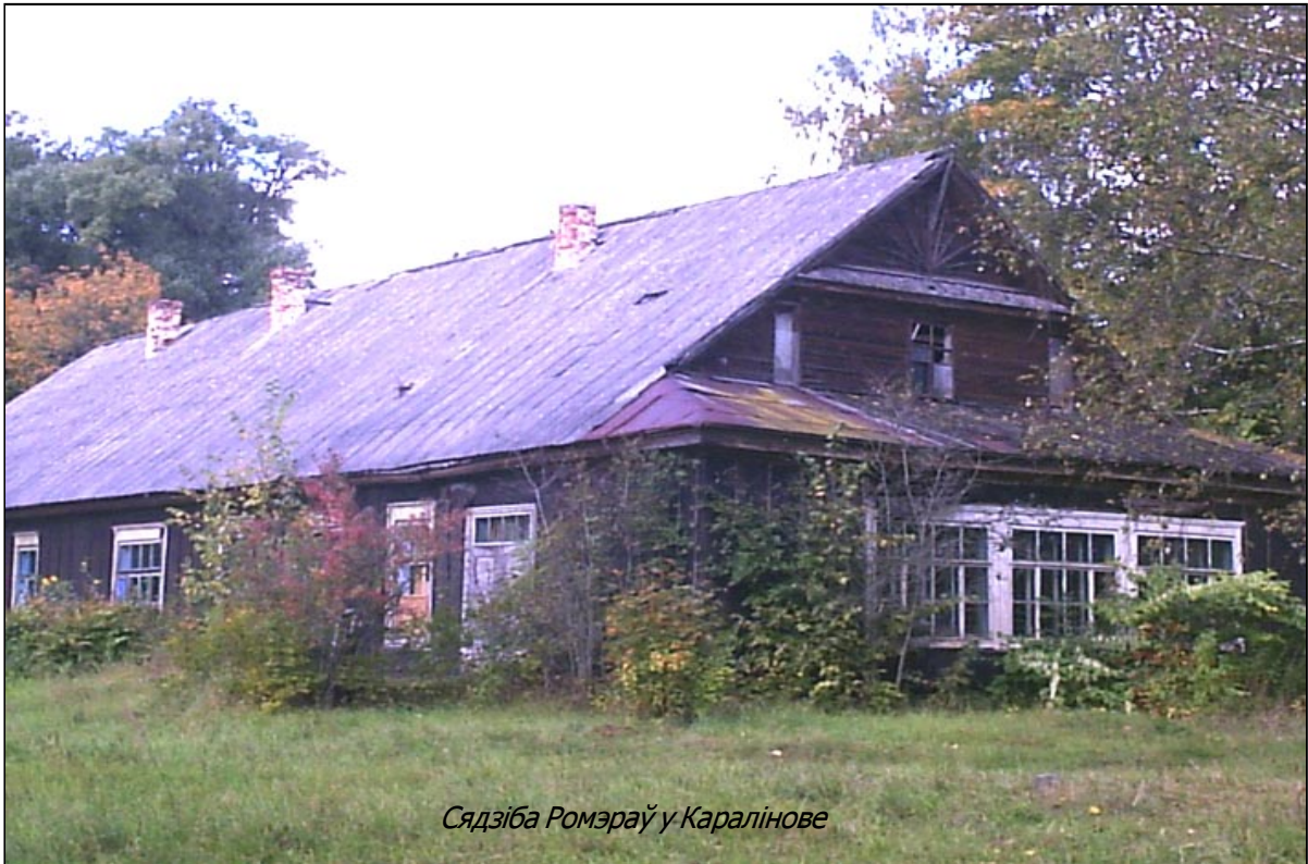
Сядзіба Ромэраў у Каралінове